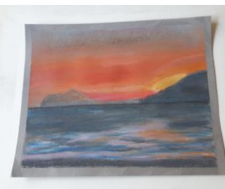
Zonsondergang in Spanje Ik heb Pastels ontdekt Werkt lekker vind ik

Ik gebruik speciaal papier voor pastels. Verschillende kleuren in 1 blok