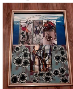
Zojuist mijn compositie voor mijn glas in loodwerk afgewerkt. Onder een onderwater afbeelding, omringd door Coronavirus. Gelukkig is de bovenkant nog OK en dat drukt hoop uit; net als de Amerikaanse verkiezingen

Geeft mij indruk van Glas in lood, erg mooi