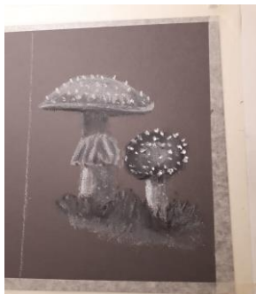
Mijn werk van vanavond. Met pastelkrijt