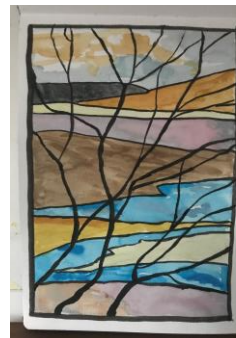
Mijn eerste poging voor ons thema: aquarel met inkt

Het is bij mij momenteel licht verslavend, merk ik