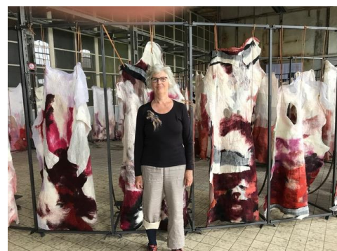
Tentoonstelling Woven Skin van Claudia Jongsma, 2018; foto Aly van Beek

Zo kunnen we ieder ons eigen Voddenproject starten. Ideeën met elkaar delen. En samen bedenken ,hoe we onze kunstwerken met elkaar verbinden. Zodra we in nieuw en veilig vaarwater zijn gekomen.